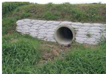
災害後の道路復旧

ミルクローリーや飼料運搬車の大型化に対応できていない町道及び農場道路の改良計画はどのようになっているか。