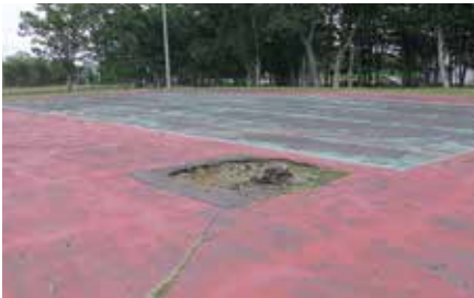
虹別テニスコート

問 虹別農村公園のテニスコートは老朽して未使用となっているが、周りの環境に合うような改修等の計画はないか。