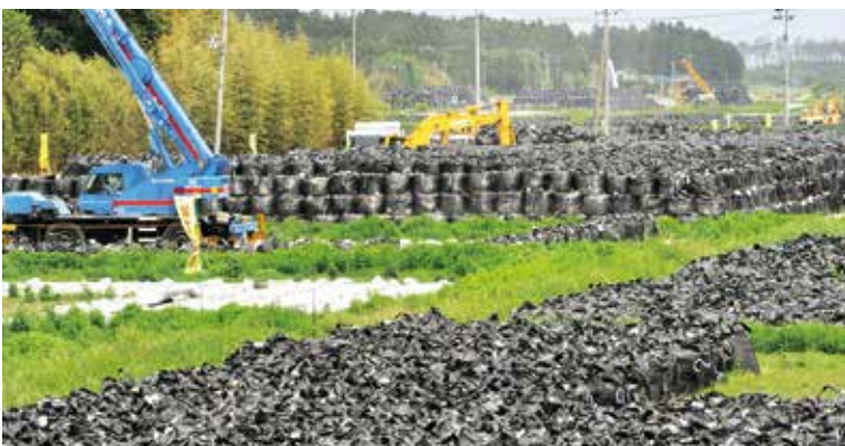
核のゴミ・福島第1原発付近

議論になったことはない。総合開発期成会として反対決議すべきとの指摘ですが、本期成会を設置目的で鑑みた場合、そぐわないものと考えられる。私は町長として町民の意向を最大限尊重する。