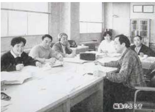
「議会だより」創刊号の編集風景

100号という節目に当たって町民のみな様と一体となった議会活動の一翼を担う「議会だより」の発行をめざしたいと思います。