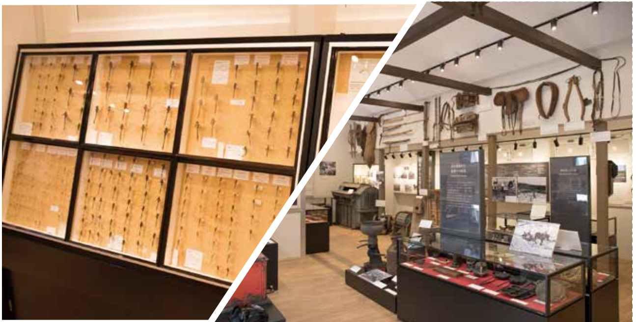
— 標茶町博物館（ニタイ・ト）飯島コレクション・館内展示室 —