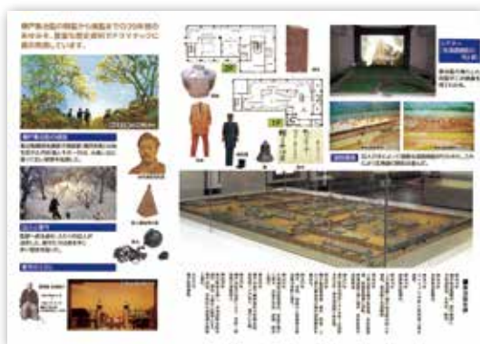
月形樺戸集治監資料

また、網走集治監は釧路集治監の分館として開庁され釧路集治監よりも新しいことや、網走く旭川間の道路建設に多くの囚人が携わったことなどの説明を受けた。 標茶町の釧路集治監に現存する資料等は、北海道開拓の歴史を知ることなどで非常に重要な資料であるとの認識を新たにし、標茶町博物館「ニタイ・ト」にも重要な役割を果たしてほしいと考えます。