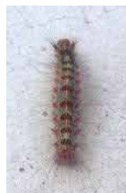
マイマイ蛾の幼虫

答 通学路を中心に町内3校の施設で駆除した。抜本的な撲滅は無理なため、対策は随時検討していく。