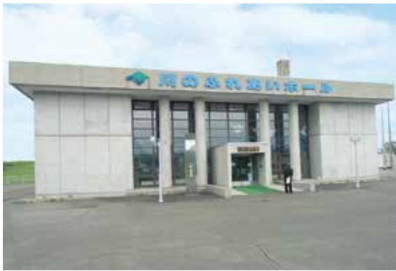
川の流れあいホール

その後、芽室町「ふるさと歴史館ねんりん」を視察、農業の歴史や農機具の展示を見る。また、本町においても稼働していた帝国亜麻会社のロープ製造工場があったことなども紹介されていた。