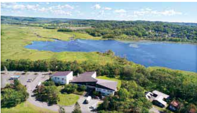
空撮による憩の家かや沼

⑥PDCAサイクルなどがビジネスモデルとして認識されているが、それも含め経営陣・現場サイドでできることがあったのではないかと考える。