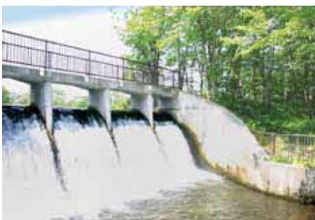
シュワンベツダム

1団地の面積が広大な草地面積になっている。そのような草地から低みに水が一気に集まってくるという現象がみられる。小川の橋が一気に流されてしまう実態もある。そのような状況にある河川は、地図に落としておくという作業はしているか。