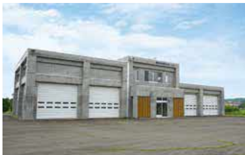
標茶町防災備蓄センター

の中に、女の子がいる世帯を対象に無償配布したり、小・中・高校の保健室に置く等の有効利用が可能か伺います。このようなデリケートな部分の問題は当事者からは、なかなかSOSは発信しづらいものです。外からは解らない見えにくい部分への支援というものが必要になってくると考えるがこの点について町としての考えを伺う。