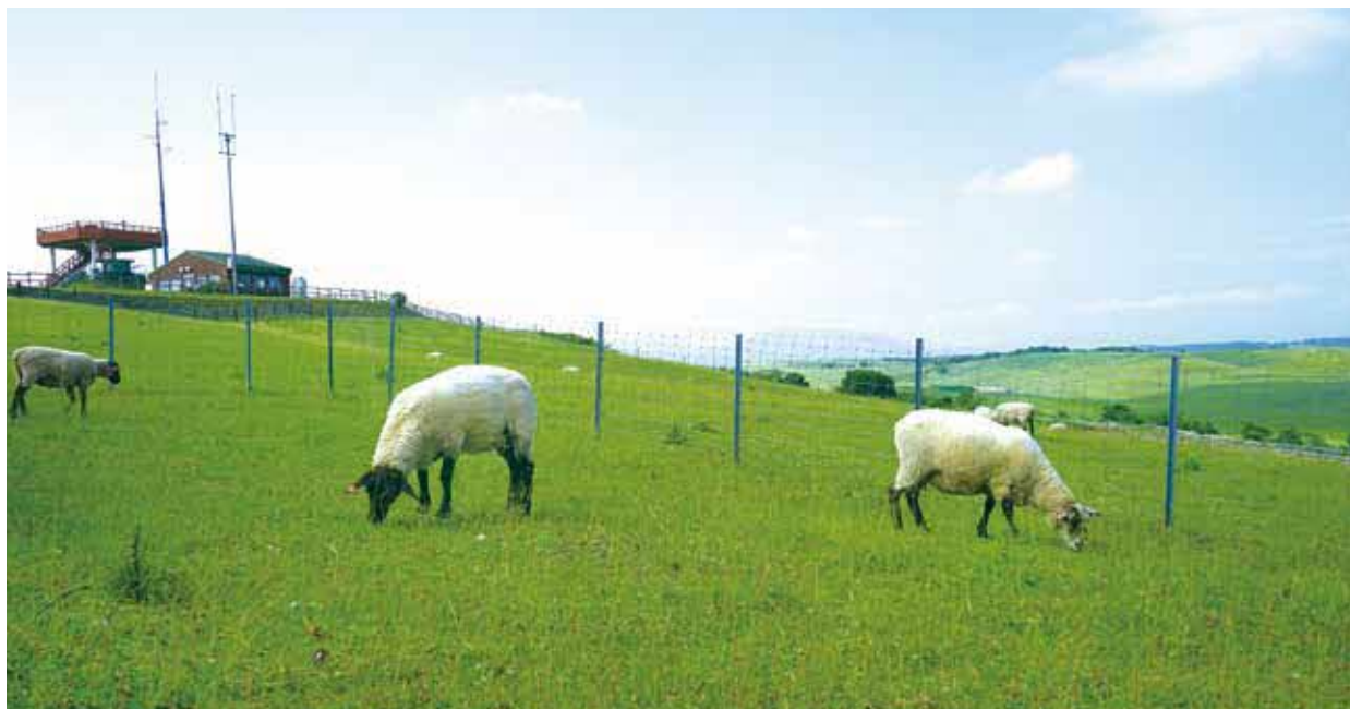
— 多和平の羊たち —