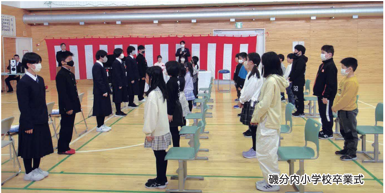
磯分内小学校卒業式