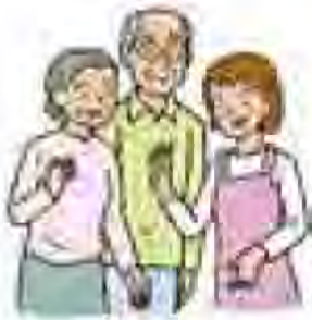
◎介護保険料月額換算の比較と移り変わり

介護サービスを利用すると料金がかかります。利用した方は料金の1割を負担し、残り9割分の一部にはみなさんの介護保険料が充てられています。介護サービスの種類や内容が制度開始当初と比べ充実し、より必要に応じたサービスを選択し利用できるようになり、全国的にサービス量が増加し介護保険料も上昇しています。