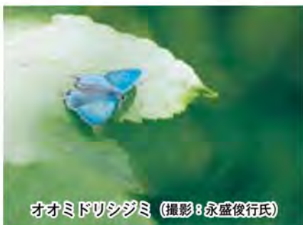
オオミドリシジミ

軍馬山の豊かな植物は、たくさんの昆 虫を育てます。スキー場の山頂周辺では 初夏〜夏にかけてミヤマカラスアゲハを 見かけますが、このチョウの後ろ翅は黒 と青の複雑な模様が印象的です。 また軍馬山ではゼフィルスと呼ばれる