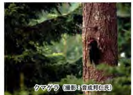
クマゲラ

シジミチヨウの仲間が10種類確認されています。このチヨウは翅が青く緑色にキラキラと輝き、「空飛ぶ宝石」と呼ばれています