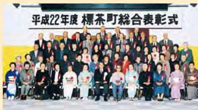
昨年の標茶町総合表彰式