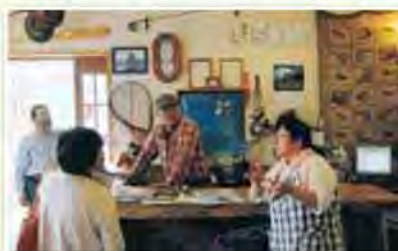
取材結果のまとめ