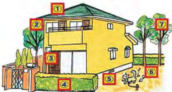
①天井裏 ②軒下 ③戸袋 ④生垣の中 ⑤床下 ⑥土の中 ⑦木の枝