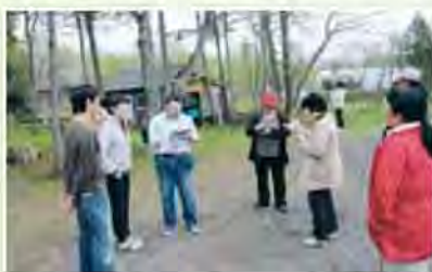
みなさんの取材風景