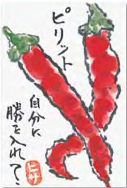
酒井 ヒサさん (旭) の作品