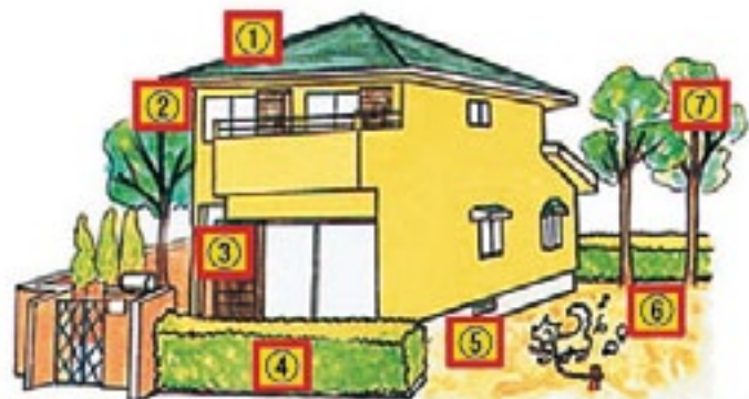
①天井裏 ②軒下 ③戸袋 ④生垣の中 ⑤床下 ⑥土の中 ⑦木の枝