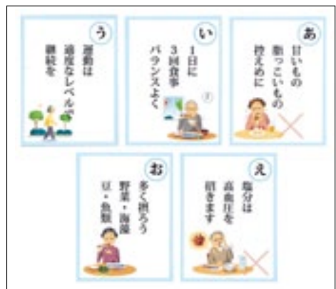
図4 動脈硬化を防ぐ生活習慣のポイント

動脈硬化は直接目に見えませんが、動脈硬化になりやすいリスクはわかっています。（図3）リスクは、重ければ重なるほど高くなります。それがたとえ低いものであっても、「ちりも積もれば山となる」のです。健診結果の値が少しだけ基準値を超えている、もしくは、ギリギリセーフでも安心してないで、少しでもリスクを減らす生