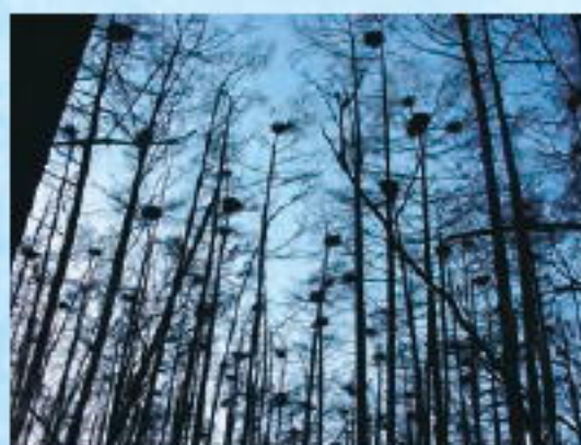
カラマツ林にあるアオサギコロニー

塘路湖にあるアオサギコロニーの中の巣は1991年に確認されてから急速に数が増え、2003年をピークに現在では200巣前後で維持されているのがわかります（図1）。塘路湖はエサが豊富にあり、巣をかけるのにちょうどいいカラマツ林もあるので、アオサギにとって暮らしやすい環境なのでしょう。