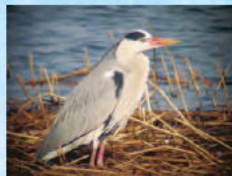
水辺にたたずむアオサギ

たずむ首と足が長い水鳥といえば、思い当たる方もいるかと思いますが。時々タンチョウに間違われますが、アオサギはタンチョウと違って首を曲げて飛び、木の上に止まることができるので見分けがつくかと思えます。