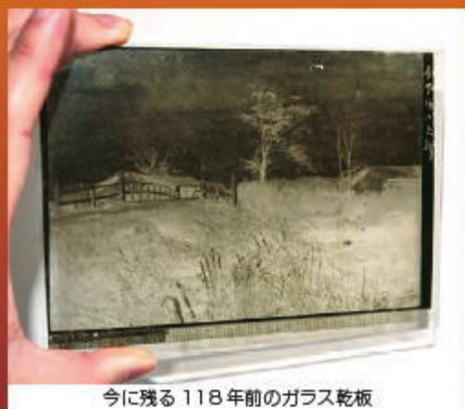
今に残る118年前のガラス乾板

烏田は札幌から明治20年頃標茶に移り住み、現在の野崎精肉店付近に居を構えました。烏田は日本人で初めて皆既日食を撮影した事で知られており、黎明期における標茶の発展にも大いに尽くしました。 大正初期頃に烏田清兵衛が亡くなった後も自宅は残されていたようです。当時を知る方のお話によれば、家の中にはガラス乾板が大量に残されていたが、建物取り壊しの際に無くなったそうです。烏田清兵衛は、標茶のどんな風景を撮っていたのか。今となっては失われた事が残念でなりません。