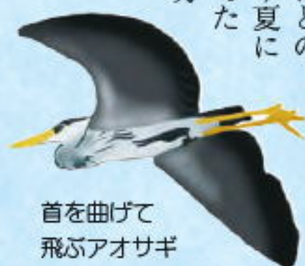
首を曲げて飛ぶアオサギ

塘路湖のほとりに、釧路管内最大のアオサギの集団巣（コロニー）があることを知っていますか？今回はアオサギを紹介します。