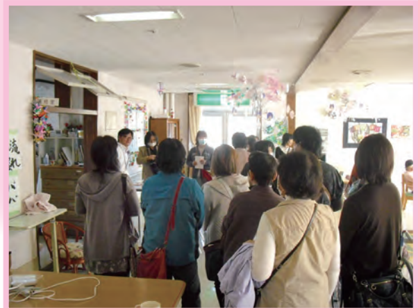
視察研修でやすらぎ園を視察