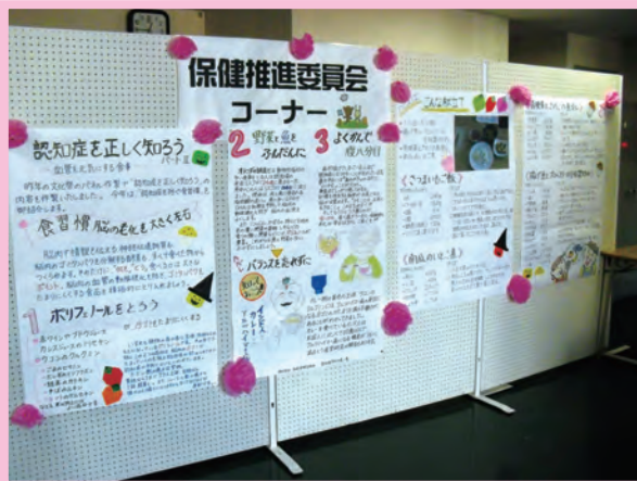
磯分内の文化祭にてパネル展示