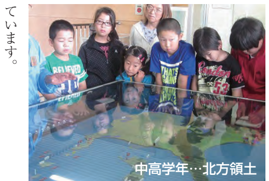
中高学年…北方領土

平成25年度は「コタンアイヌ民族資料館」(弟子屈町)や、「北方領土館」(標津町)などに見学に向かいます。間近で見たり聞いたりする中から、課題作りの材料選びや解決のための資料探しなどに役立て