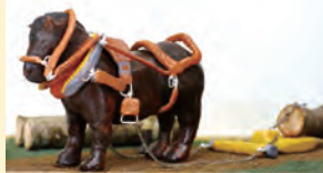
展示中の農耕馬模型

日程 2月 4日(火)～10日(月)…沼幌小学校 12日(水)～17日(月)…久著呂中央小学校 18日(火)～28日(金)…図書館