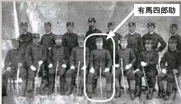
20代半ば頃の有馬四郎助。

疫委員も拝命し、着任早々鹿兒島で発生したコレラ流行の際に尽力し後に慰労金を貰うなど活躍しましたが、翌19年9月に依願免職。これは北海道集治監の看守を全国公募する事を知り、募集に志願するためでした。