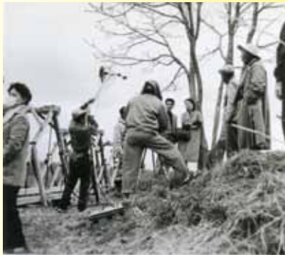
塘路での『挽歌』ロケ風景 写真中央コートを羽織った女性は女優高峰三枝子。

釧路を代表する小説家原田康子の代表作「挽歌」。小説の反響を受けて1957年に上映された五所平之助監督による映画「挽歌」は、ロケ地に塘路の軌道橋が使われるなど本町に関わりがある映画です。映画自体も大ヒットし、道東観光の火付け役となったほか「挽歌族」「挽歌スタイル」などの言葉を生み出す社会現象にもなり、高く評価されました。本講では改めて「挽歌」について解説した後、上映会を行います。昭和30年代初頭の釧路や標茶の姿がスクリーンに躍ります。どうぞ参加してください。