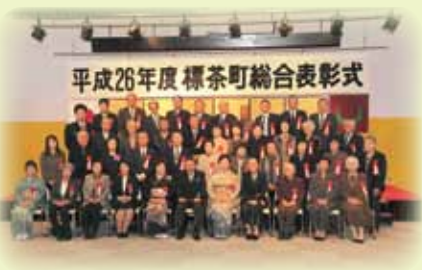
昨年の標茶町総合表彰式