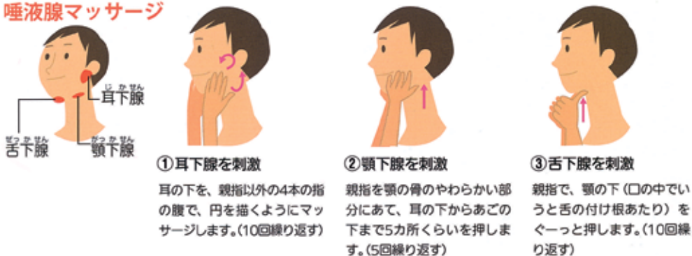
図1 唾液腺マッサージ

菌が繁殖しやすくなるので、特に寝る前は、歯の裏側と表側、噛みあわせ部分を小刻みにやさしく丁寧に磨きましょう。そのためには、歯磨き粉の量は少しで十分です。 2. 糸ようじなどのアイテムも使おう！ 歯ブラシだけでは汚れを落とすきれえません。歯と歯の間にたまりやすい細菌をデンタルフロスや歯間ブラシなどで落としましょう。歯の並びや隙間にあわせて使いやすいのを選びましょう。 3. 唾液の分泌を高めよう！ 加齢やストレス、口呼吸、噛む回数が減ると唾液の分泌が減り、口の中の細菌が繁殖しやすくなります。よく噛んで食べることが大事です。繊維質の食べ物や酸っぱい物もおすすめです。唾液が出づらい方は、図1の唾液腺マッサージを試してみてください。 4. 歯科医院で定期的に検診を受けよう！ 日頃のケアではどうしても落とすきれない歯垢や、知らないうちにむし歯や歯周病が進行している場合があります。年に1度は定期検診をおすすめします。