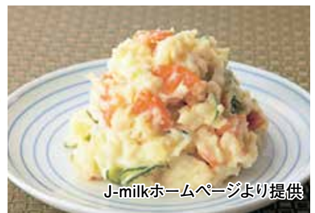
J-milkホームページより提供