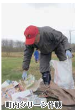
町内クリーン作戦