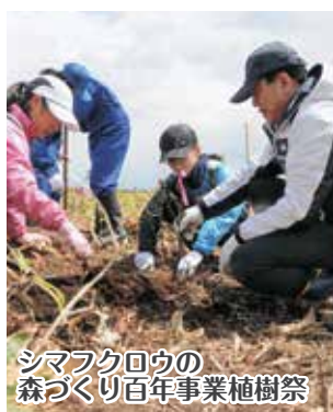
シマフクロウの 森づくり百年事業植樹祭