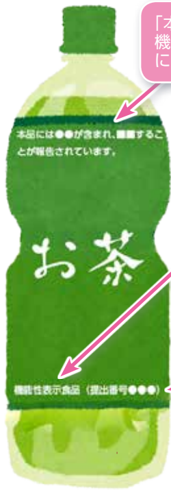
図1 機能性食品の表示例

「本品に○○が含まれているので、□□の機能があります」などの科学的根拠をもとにした機能性について表示されています。