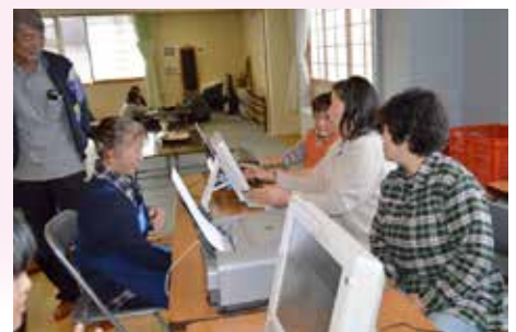
地区活動 地域文化祭での 健康相談コーナー