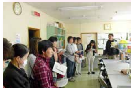
全体活動 中標津町就労支援A型 事業所への視察研修