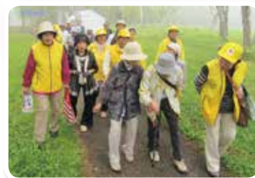
単身高齢者との懇親会