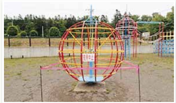
グローブジャングル（回転遊具）