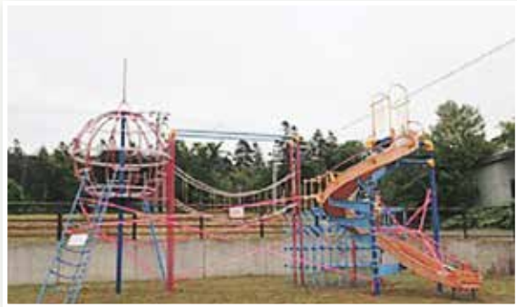
コンビネーション遊具

コンビネーション遊具は8月中旬以降に工事をを行い、10月末の完成を予定しています。その間の公園利用について、ご理解とご協力をお願いします。