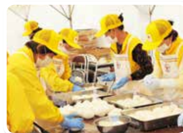
釧路川総合水防演習での炊き出し訓練