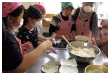
親子料理教室の様子

皆さん「食生活改善協議会」というグループをご存じですか？この協議会は、高齢化・生活習慣病など食に関わる問題の増加から「私たちの健康は私たちの手で」をスローガンに、バランスのとれた食生活について学習会を行い、学んだことを自ら実行し、家族・友人、地域の人たちとの触れ合いを通じて地域の健康づくりに貢献できるように、食を通じた活動をすることを目的としています。全国の市町村に協議会があり、本町には平成8年に協議会が設立され、今年で21年目を迎えました。現在28人が加入しており、設立時に加入した推進員は今も活動している方が多くいます。 本町では、小学生の親子を対象とした「親子料理教室」や牛乳・乳製品の摂取をすすめる「生涯骨太クッキング」など推進員が講師となり教室を開催したり、食事や健康づくりに関するテーマで調理実習や学習会などを行っています。また、秋に行われる「標茶町健康まつり」では、毎年テーマに沿った試食や展示を行っており、今年はいくバランス