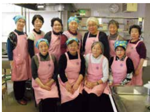
ピンクのエプロンで活動しています

よく「毎日のくらしにwithミルク」をテーマに120食提供しました。そのほかにも、本町で実施している事業に協力し、年間さまざまな活動をしています。推進員からは： ・食や健康に対する意識が高まった。 ・苦手で今まで使わなかった食材を、学習会を通して使うようになった。 ・活動を通して食に関心を持つようになり、自分や家族等の健康を見直すきっかけになっていくようです。 ・「食事」は、健康な体づくりに大きく影響します。毎日いきいきとした生活を送るために、食を通じた活動を「自分のために」「地域のために」してみませんか？