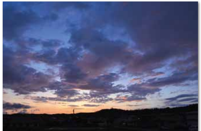
賀東 嘉廣さん（桜）の作品