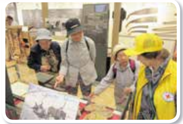
単身高齢者との懇親会