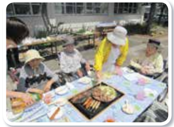
特別養護老人ホームでの奉仕活動