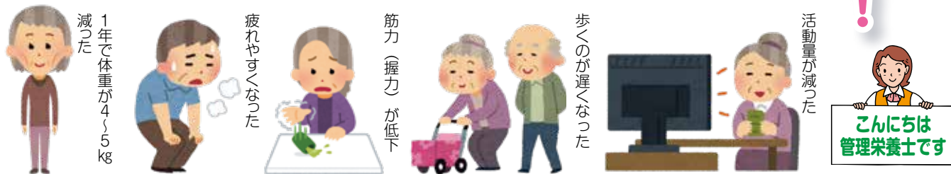
図1 フレイルチェック

フレイルは進行していくと、日常生活に障害が起こり、閉じこもりや孤立に至り、要介護状態になりやすくなります。3つのポイントを実践し、フレイルを予防改善し、健康な体でできるだけ長く楽しく暮らしていきましょう！