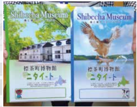
来館者プレゼントのクリアファイル