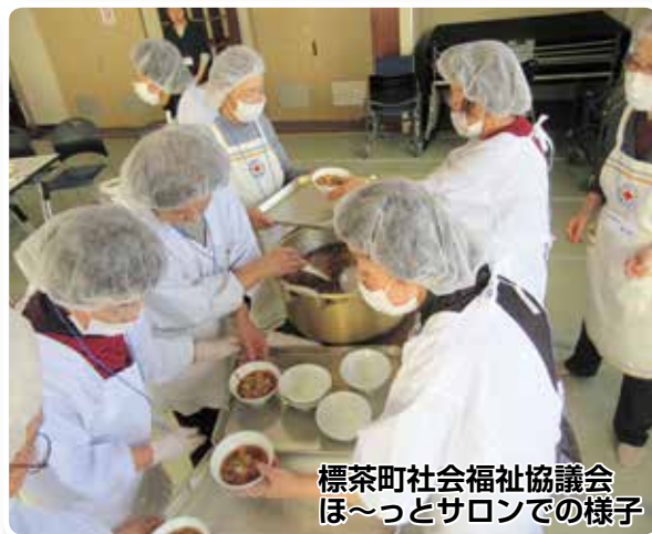
標茶町社会福祉協議会 ほっとサロンでの様子

標茶町社会福祉協議会各サービスの手伝い（高齢者世帯対象のお弁当作り、布団乾燥サービスの提供）・やすらぎ園での奉仕活動（雑巾縫い、野外会食の手伝い）・福祉運動会でのオードブル調理・町防災訓練での炊き出し調理・単身高齢者との懇親会・視察研修