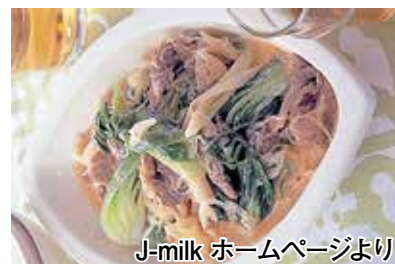
J-milk ホームページより