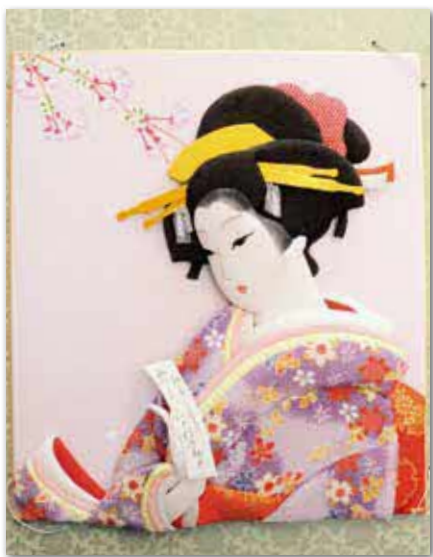
小館キヨコさん（麻 生）の作品