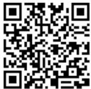
地域おこし協力隊 YouTubeチャンネル

当面の取り組みとしては、4月29日から運行を開始した「くしろ湿原ノロッコ号」の川湯温泉延長運転（6月12日・10月29日の2日間）に合わせた標茶駅