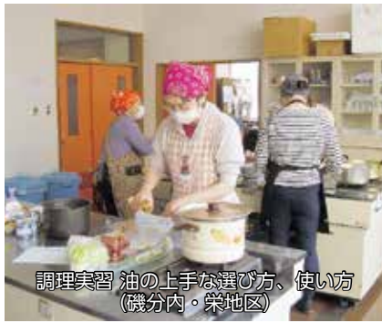
調理実習 油の上手な選び方、使い方 (磯分内・栄地区)