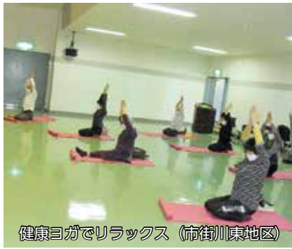
健康ヨガでリラックス (市街川東地区)