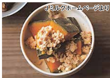
「ミルクホームページより」