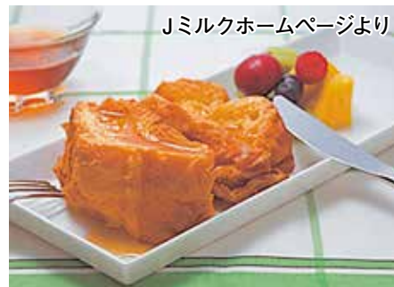
Jミルクホームページより