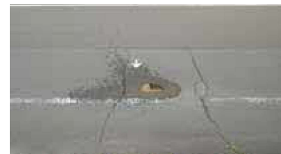
▲路面が濡れているとの通報で発見できた漏水箇所